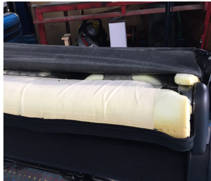
① 背もたれ部チャックを開けて下さい。