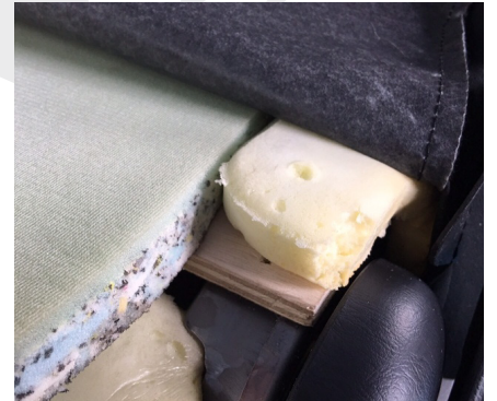
② 縁の純正スポンジの下に板を滑りこませて下さい。