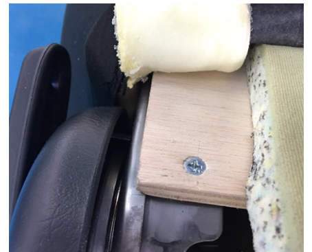
③ 手前左右の小さい穴に付属のビスで、板とフレームを留めて下さい。